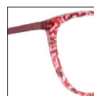
HAU172 prunescarlet 'scarlet' plum