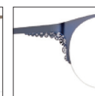
CAR34 bleusaphir 'saphir' blue