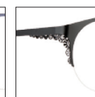
CAR35 noirkhól 'khól' black