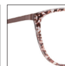
HAU174 marronbichefoncé dark 'biche' brown