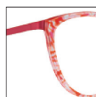
HAU171 rosesunset 'sunset' pink