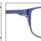
CAR24 bleuminuit 'minuit' blue