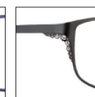
CAR25 noirkhól 'khól' black