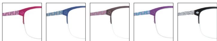
GRA41 rosebaby-dollfoncé dark 'baby-doll' pink GRA42 bleunavy 'navy' blue GRA43 marronsantal 'santal' brown GRA44 violetpunkette 'punkette' purple GRA45 noirkhôl 'khôl' black