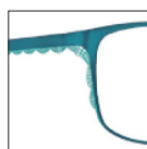
CAR11 bleulagon 'lagon' blue