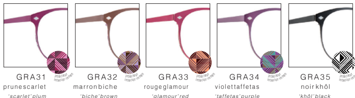
GRA31 prunescarlet 'scarlet' plum GRA32 marronbiche 'biche' brown GRA33 rougeglamour 'glamour' red GRA34 violettaffetas 'taffetas' purple GRA35 noirkhôl 'khôl' black