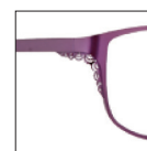
CAR23 violettaffetas 'taffetas' purple