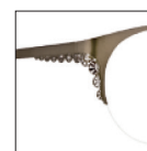
CAR33 bronzebijou 'bijou' bronze