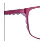
CAR13 rose vintage 'vintage' pink