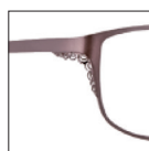
CAR21 marronsantal 'santal' brown