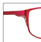
CAR22 rougerubis 'rubis' red