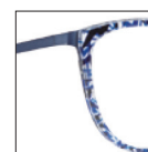
HAU173 bleusaphir 'saphir' blue