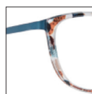
HAU144 marronété-bleupétolette 'été' brown-'pétolette' blue