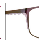
CAR14 marronsantal 'santal' brown