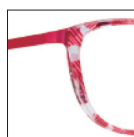
HAU142 rosebaby-doll 'baby-doll' pink