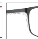
CAR15 noirkhól-blancgeisha 'khól' black - 'geisha' white