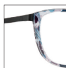
HAU143 bleudenim-noirkhôl 'denim' blue-'khôl' black