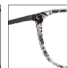
HAU175 noirkhôl 'khôl' black