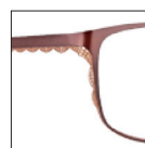
CAR12 marronété 'été' brown