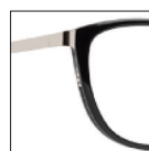
HAU145 noirkhôl-argentprincesse 'khôl' black-'princesse' silver