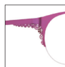
CAR32 violetindien 'indien' purple