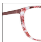
HAU141 brunsable 'sable' brown