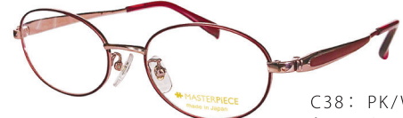
C38: PK/WN ピンク／ワイン