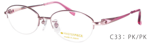
C33: PK/PK ピンク / PK