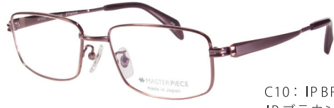
C10: IPBR IPブラウン