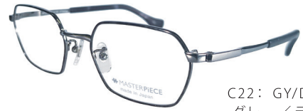
C22: GY/DM グレー/デミ