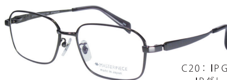
C20: IPGY IPグレー