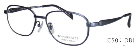
C50: DBL ミステリアスブルー