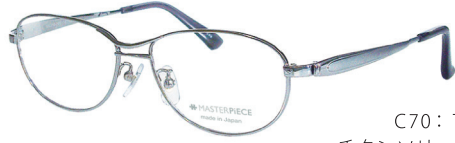
C70: TI チタンソリッド