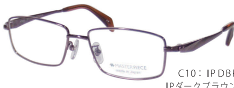
C10: IPDBR IPダークブラウン