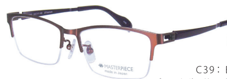
C39: BD ブラックボルドー / BK