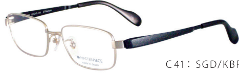
C41: SGD/KBR シャンパンゴールド / レザーブラウン