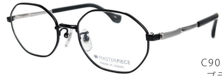
C90: BK ブラック