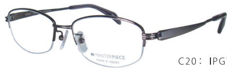
C20: IPGY IPグレー