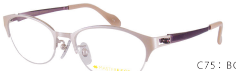
C75: BG アイボリー