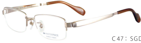
C47: SGD シャンパンゴールド