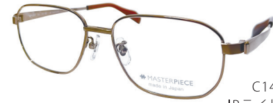
C14: IPLBR IPライトブラウン