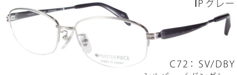
C72: SV/DBY シルバー/ガングレー