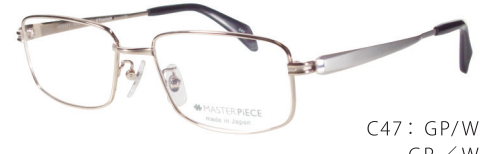
C47: GP/W GP/W