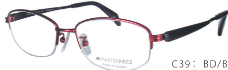
C39: BD/BK ボルドー / ブラック