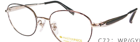
C72: WP/GYDM WP／グレーデミ