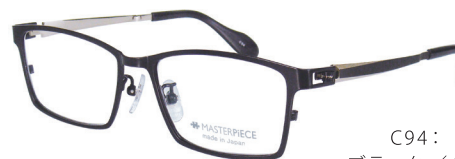
C94: BK ブラック / GP