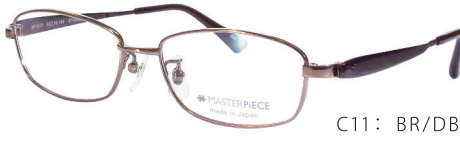
C11: BR/DBR ブラウン / ダークブラウン