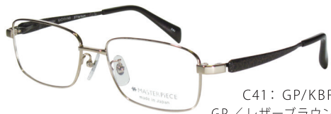
C41: GP/KBR GP/レザーブラウン