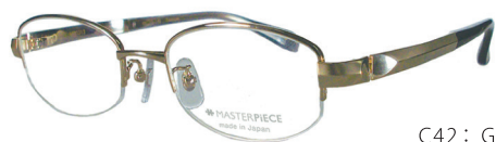
C42: GP GP