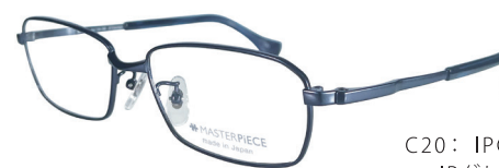
C20: IPGY IPグレー