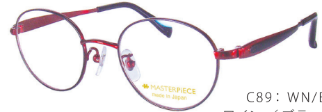
C89: WN/BK ワイン／ブラック