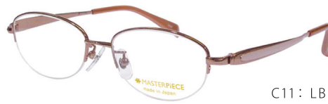
C11: LBR Lブラウン／ベージュ