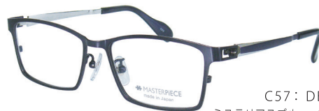
C57: DBL ミステリアスブルー / W