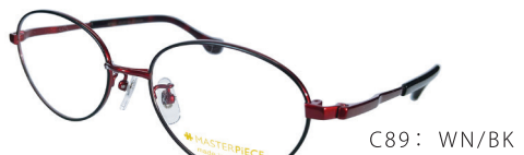
C89: WN/BK ワイン / ブラック