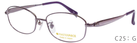
C25: GY グレー／パープル