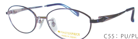
C55: PU/PU パープル／パープル