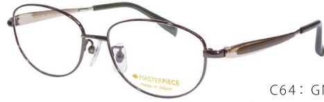
C64: GN グリーン／GP