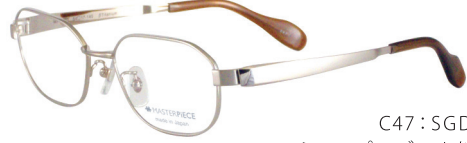
C47: SGD シャンパンゴールド