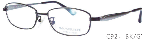
C92: BK/GY ブラック / グレー