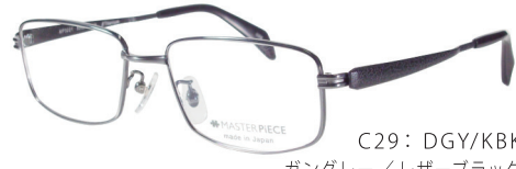
C29: DGY/KBK ガングレー/レザーブラック