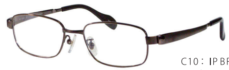
C10: IPBR IPブラウン