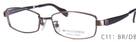
C11: BR/DBR ライトブラウン/BRM