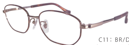
C11: BR/DM ブラウン / デミ