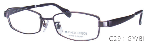
C29: GY/BK ダークガンマット/BKM