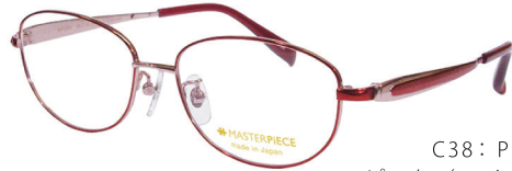
C38: PK ピンク／ワイン