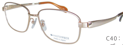
C40: GP ゴールド