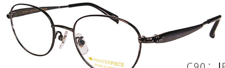
C90: IPBK IPブラック