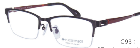
C93: BK ブラックマット / RD