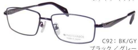
C92: BK/GY ブラック/グレー