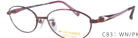
C83: WN/PK ワイン／ピンク