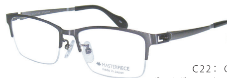
C22: GY ダークグレー / GUN