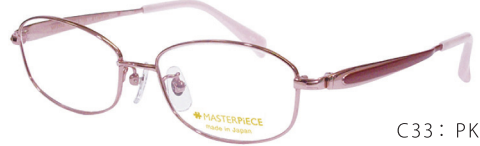
C33: PK ピンク／レッド