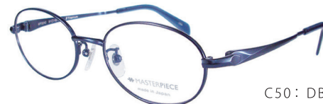
C50: DBL ミステリアスブルー