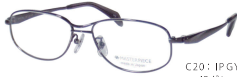
C20: IPGY IPグレー