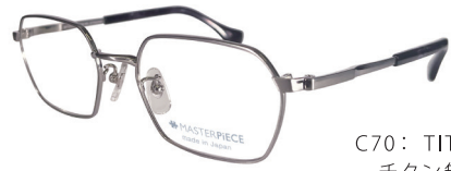
C70: TITAN チタン無垢