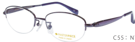
C55: NV ネイビー／パープル