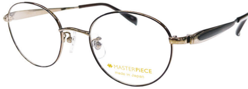
C11: BR/BK ブラウン／ブラック