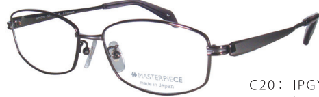
C20: IPGY IPグレー