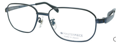
C50: DBL ミステリアスブルーマット