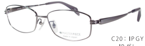
C20: IPGY IPグレー