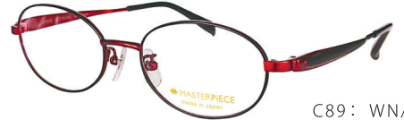
C89: WN/BK ワイン／ブラック