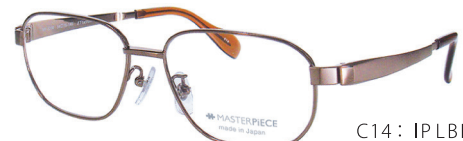
C14: IPLBR IPライトブラウン