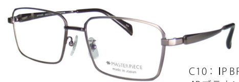
C10: IPBR IPブラウン