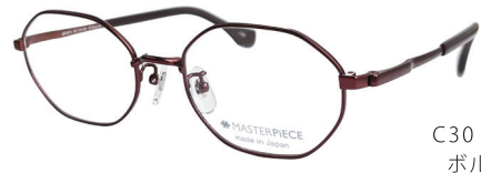
C30: BD ボルドー