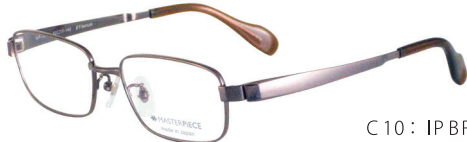
C10: IPBR IPブラウン