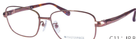
C11: IP BR IPブラウン