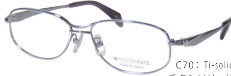
C70: Ti-solid チタンソリッド