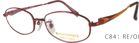
C84: RE/OR パールレッド / オレンジ