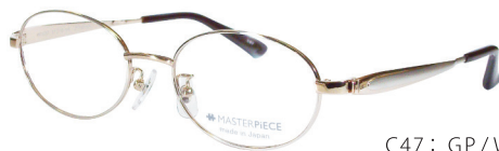
C47: GP/W GP/PD