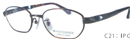
C21: IP GY IPグレー