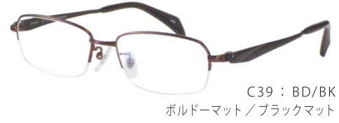
C39: BD/BK ボルドーマット/ブラックマット