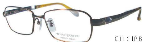
C11: IP BR IPブラウン