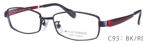
C93: BK/RD ブラックマット/PRD