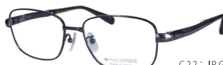
C22: IP GY IPグレー