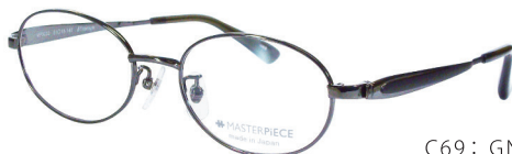
C69: GN ブラックオリーブ / ブラック