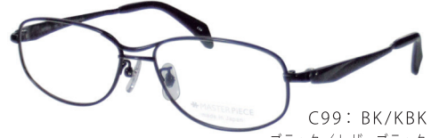
C99: BK/KBK ブラック/レザーブラック