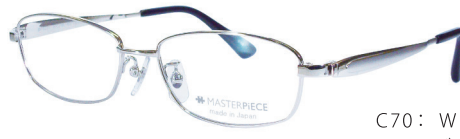
C70: WH シルバー