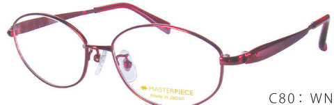
C80: WN ワイン