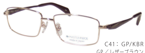
C41: GP/KBR GP/レザーブラウン