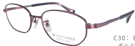
C30: BD ボルドー