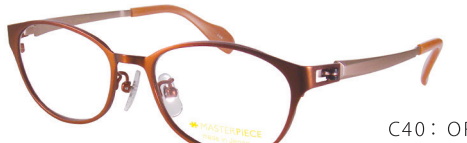
C40: OR オレンジ