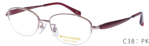
C38: PK ピンク／ワイン