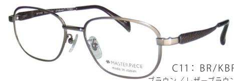
C11: BR/KBR ブラウン/レザーブラウン