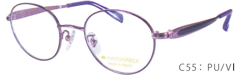
C55: PU/VI パープル／バイオレット