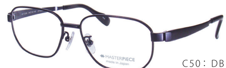
C50: DBL ミステリアスブルーム