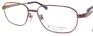
C10: IPBR IPブラウン