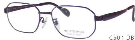
C50: DBL ミステリアスブルーマット