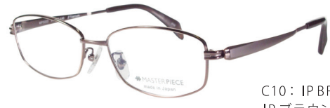
C10: IPBR IPブラウン