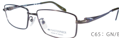
C65: GN/BL グリーン/ミステリアスブルー