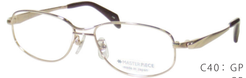
C40: GP GP