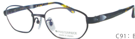
C91: BK ブラック