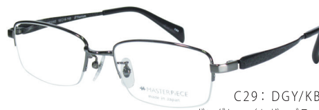
C29: DGY/KBK ガングレー/レザーブラック