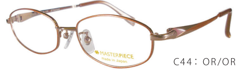
C44: OR/OR ライトオレンジ / オレンジ