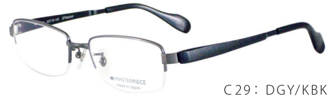
C29: DGY/KBK ガングレー / レザーブラック