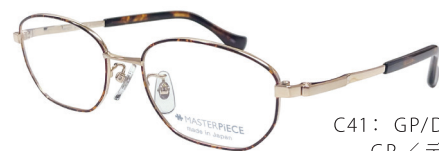
C41: GP/DM GP / デミ