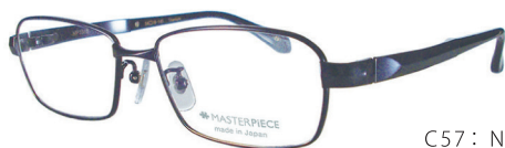
C57: NV ネイビー