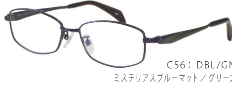
C56: DBL/GN ミステリアスブルーマット/グリーン