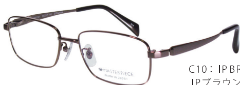
C10: IPBR IPブラウン