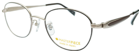
C41: GMT/BR Gマット／ブラウン