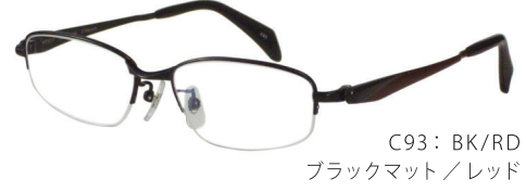
C93: BK/RD ブラックマット/レッド