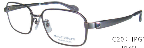
C20: IPGY IPグレー