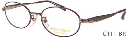
C11: BR/DM ブラウン／デミ