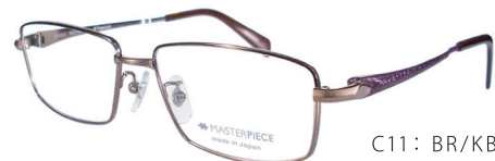
C11: BR/KBR ブラウン/レザーブラウン