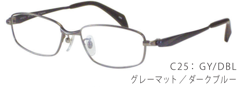
C25: GY/DBL グレーマット/ダークブルー