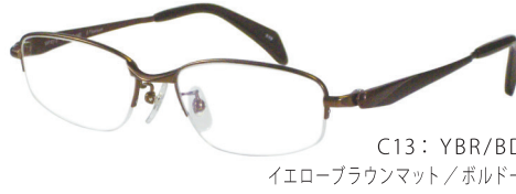
C13: YBR/BD イエローブラウンマット/ボルドー