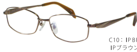
C10: IPBR IPブラウン