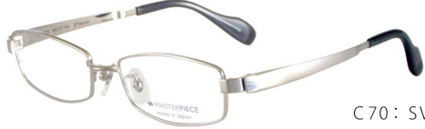
C70: SV シルバー