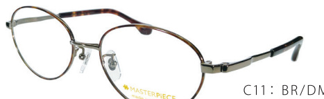
C11: BR/DM ブラウン / デミ