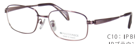
C10: IPBR IPブラウン