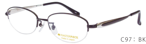
C97: BK ブラック／WP