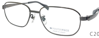
C20: IPDGY IPダークグレー