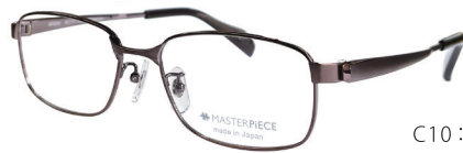
C10: IPBR IPブラウン