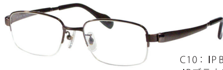
C10: IPBR IPブラウン