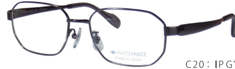
C20: IPGY IPグレー