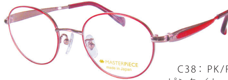
C38: PK/RD ピンク／レッド