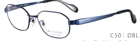
C50: DBL ミステリアスブルー