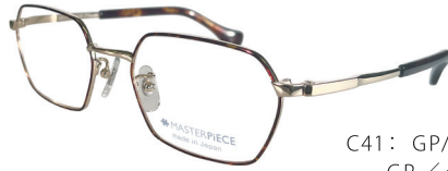
C41: GP/DM GP/デミ