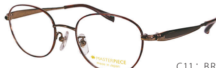
C11: BR/DM ブラウン／デミ