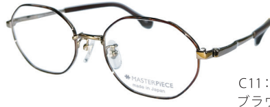
C11: BR/DM ブラウン/デミ