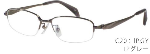
C20: IPGY IPグレー