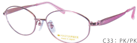
C33: PK/PK ピンク／ピンク