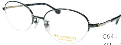
C64: GN/GP グリーン / GP