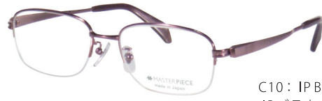
C10: IPBR IPブラウン