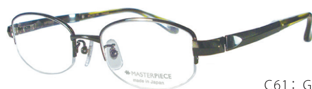
C61: GN グリーン