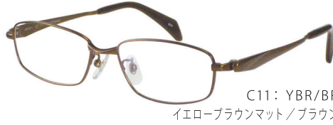
C11: YBR/BR イエローブラウンマット/ブラウン