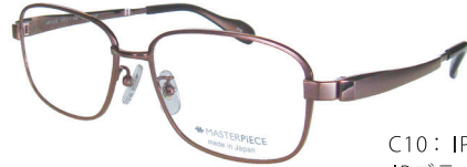
C10: IPBR IPブラウン