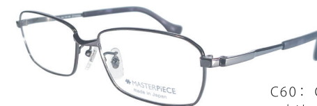
C60: OV オリブ