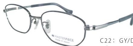
C22: GY/DM グレー / デミ