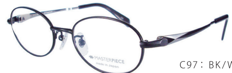
C97: BK/W ブラック/W