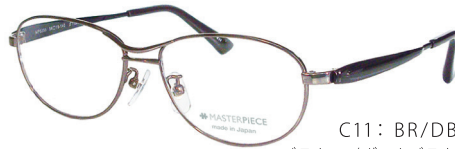
C11: BR/DBR ブラウン/ダークブラウン