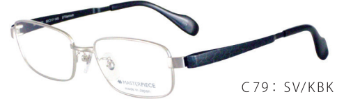
C79: SV/KBK シルバー / レザーブラック