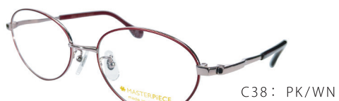
C38: PK/WN ピンク / ワイン