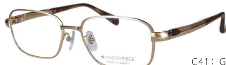
C41: GP GP