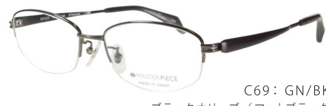
C69: GN/BK ブラックオリーブ/マットブラック