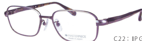
C22: IP GY IPグレー