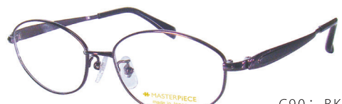
C90: BK ブラック