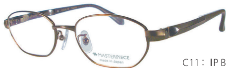
C11: IP BR IPブラウン