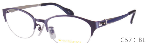
C57: BL ブルー