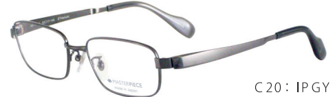
C20: IPGY IPグレー