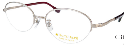
C30: PK ピンク