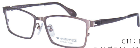
C11: BR ライトブラウン / DBR