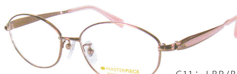
C11: LBR/BE ブラウン／ベージュ