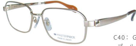
C40: GP ゴールド