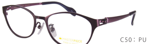
C50: PU バイオレッド