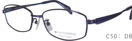
C50: DBL ダークブルー