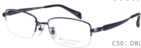
C50: DBL ミステリアスブルー