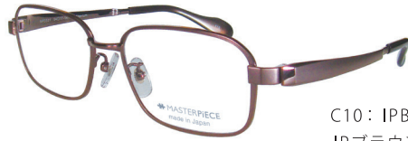
C10: IPBR IPブラウン