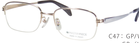
C47: GP/W GP/W