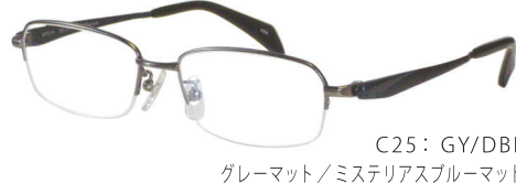
C25: GY/DBL グレーマット/ミステリアスブルーマット