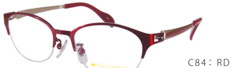
C84: RD レッド