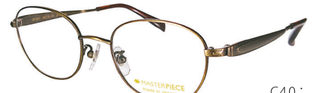
C40: AG アンティークゴールド