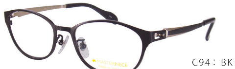
C94: BK ブラック