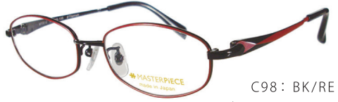
C98: BK/RE ブラック / レッド