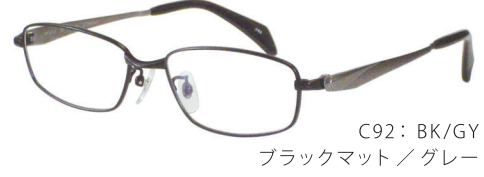
C92: BK/GY ブラックマット/グレー