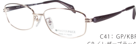
C41: GP/KBR GP/レザーブラック