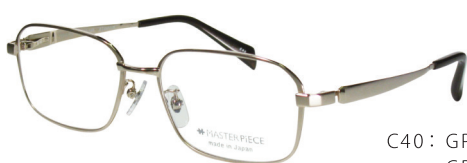
C40: GP GP