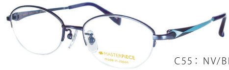
C55: NV/BL ネイビー / BL