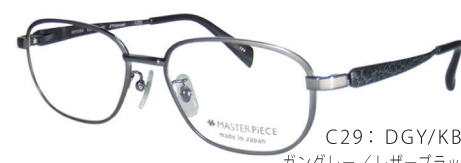
C29: DGY/KBK ガングレー/レザーブラック