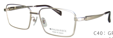
C40: GP GP