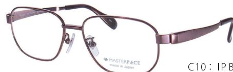
C10: IPBR IPブラウン