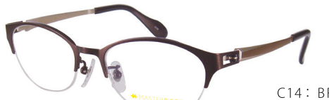
C14: BR ブラウン