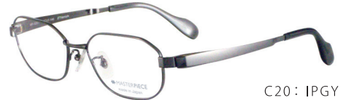
C20: IPGY IPグレー