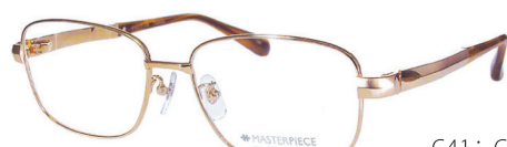
C41: GP GP