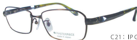
C21: IP GY IPグレー