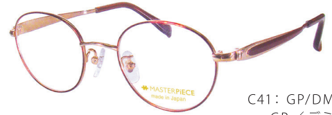
C41: GP/DM GP／デミ