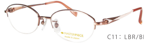
C11: LBR/BE Lブラウン / BE