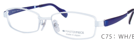
C75: WH/BL ホワイトマット/PBL