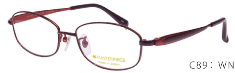
C89: WN ワイン／ブラック