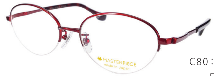
C80: WN ワイン