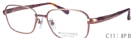
C11: IP BR IPブラウン