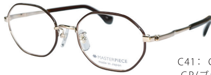
C41: GP/BR GP/ブラウン