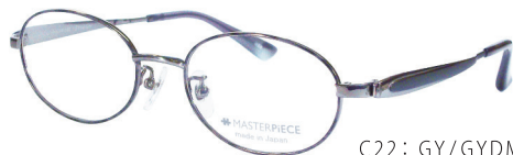
C22: GY/GYDM グレー / グレーデミ