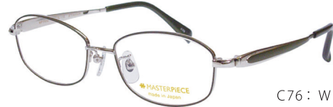
C76: WP WP／グリーン