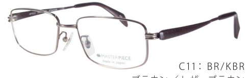
C11: BR/KBK ブラウン/レザーブラウン