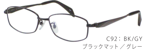
C92: BK/GY ブラックマット/グレー