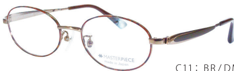
C11: BR/DM ブラウン / ブラウンデミ