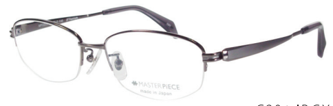
C20: IPGY IPグレー