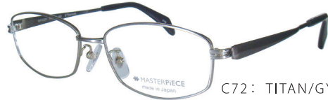
C72: TITAN/GY チタン無垢 / ガングレー