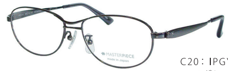
C20: IPGY IPグレー