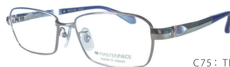
C75: TIS チタンソリッド