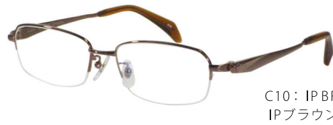
C10: IPBR IPブラウン