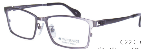
C22: GY ガングレー / DGY