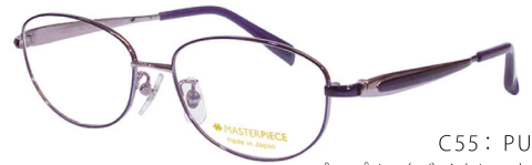
C55: PU パープル／バイオレット