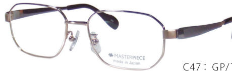
C47: GP/TI GP/チタンソリッド