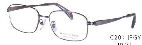
C20: IPGY IPグレー