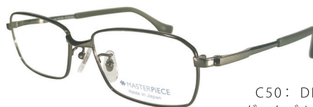
C50: DBL ダークブルー