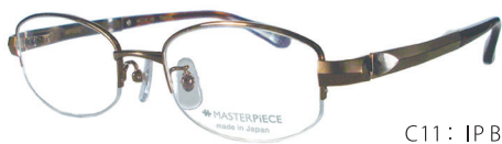
C11: IP BR IPブラウン