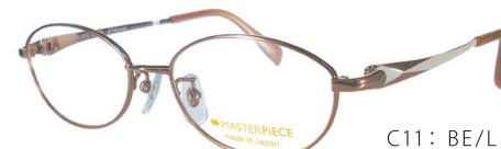
C11: BE/LBE ベージュ／ライトベージュ