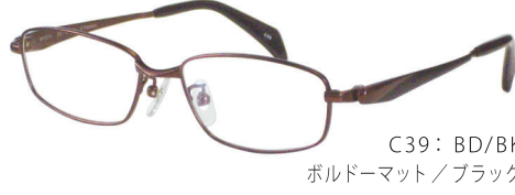
C39: BD/BK ボルドーマット/ブラック