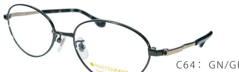
C64: GN/GP グリーン / GP