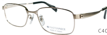
C40: GP ゴールド