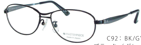
C92: BK/GY ブラック/グレー