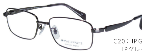
C20: IPGY IPグレー