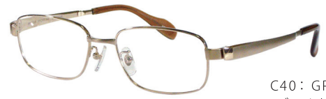
C40: GP ゴールド