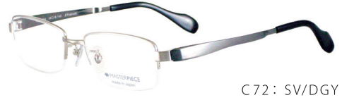
C72: SV/DGY シルバー / ガングレー