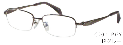
C20: IPGY IPグレー