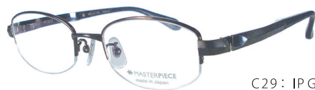
C29: IP GY IPグレー