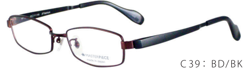
C39: BD/BK ボルドーマット / ブラックマット