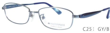
C25: GY/BL グレー / ミステリアスブルーマット