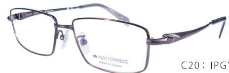
C20: IPGY IPグレー