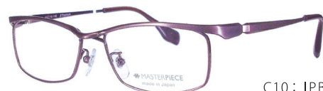
C10: IPBR IPブラウン