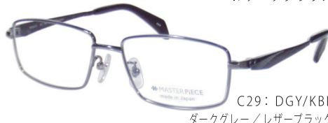
C29: DGY/KBK ダークグレー/レザーブラック