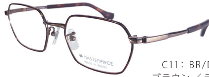
C11: BR/DM ブラウン/デミ