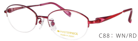
C88: WN/RD ワイン / RD