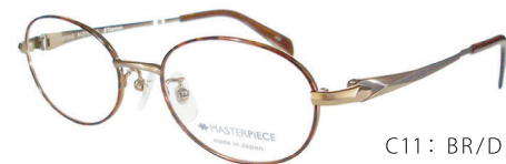
C11: BR/DM ブラウン/ブラウンデミ