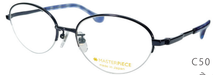
C50: NV ネイビー