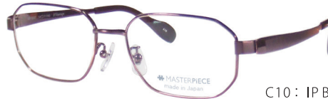
C10: IPBR IPブラウン