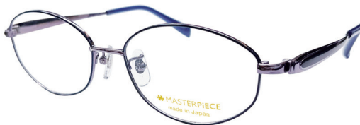
C58: PU/VO パープル／VO