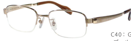
C40: GP ゴールド