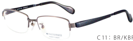
C11: BR/KBR ブラウン / レザーブラウン