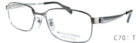
C70: TITAN チタン無垢