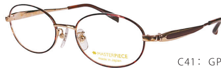
C41: GP/DM GP／デミ