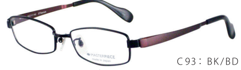
C93: BK/BD ブラックマット / ボルドーマット