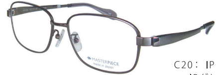
C20: IPGY IPグレー