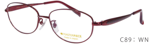
C89: WN ワイン／ブラック