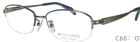
C60: OV オリーブ