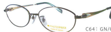
C64: GN/GP グリーン／ゴールド