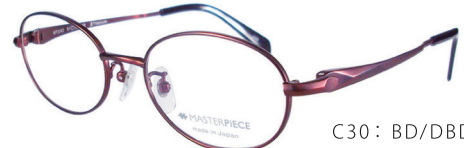
C30: BD/DBD ボルドー/ダークボルドー