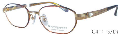
C41: G/DM ゴールド/デミ