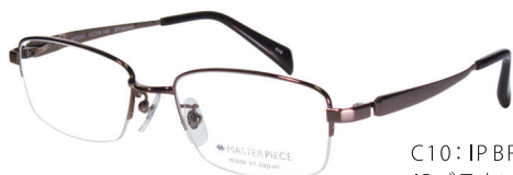
C10: IPBR IPブラウン