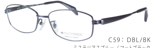
C59: DBL/BK ミステリアスブルー/マットブラック