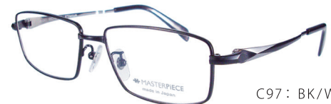
C97: BK/W ブラック/W