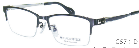
C57: DBL ミステリアスブルー / W