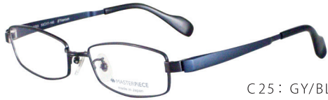
C25: GY/BL グレー / ミステリアスブルー