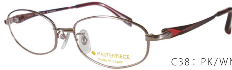
C38: PK/WN ピンク / ワイン