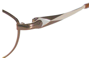
C11 : BE/LBE ベージュ / ライトベージュ