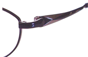
C55 : PU/PU パープル / パープル