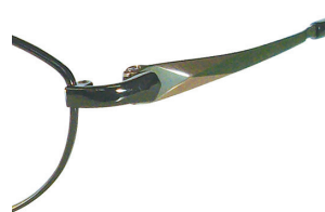
C64 : GN/GP グリーン / ゴールド