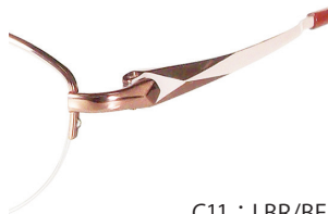
C11 : LBR/BE L ブラウン / BE