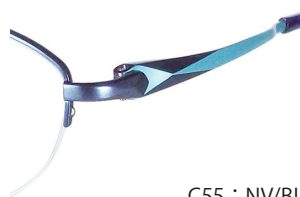
C55 : NV/BL ネイビー / BL