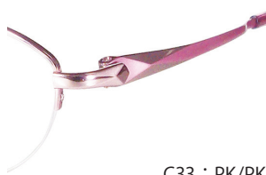
C33 : PK/PK ピンク / PK