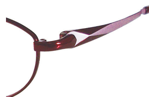
C83 : WN/PK ワイン / ピンク