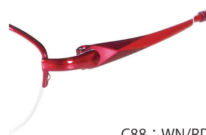
C88 : WN/RD ワイン / RD