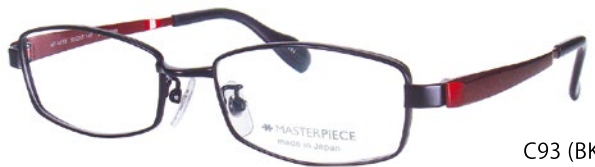
C93 (BK/RD) ブラックマット / PRD