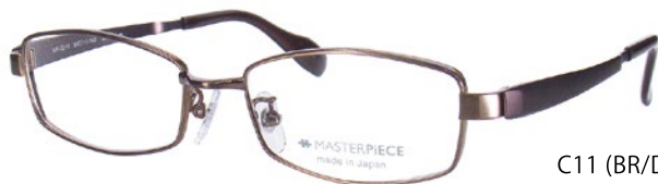
C11 (BR/DBR) ライトブラウン / BRM