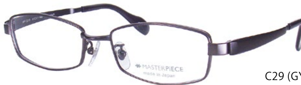
C29 (GY/BK) ダークガンマット / BKM