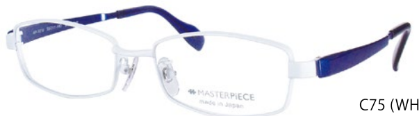
C75 (WH/BL) ホワイトマット / PBL