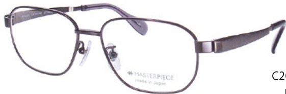
C20 (IP GY) IP グレー