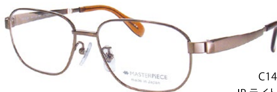
C14 (IP LBR) IP ライトブラウン