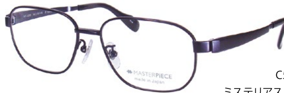
C50 (DBL) ミステリアスブルーM