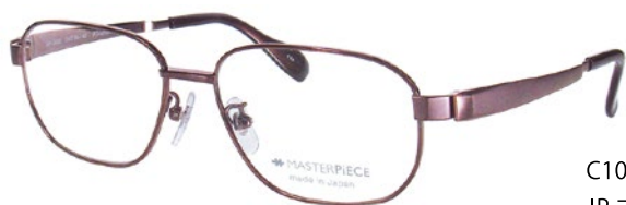
C10 (IP BR) IP ブラウン