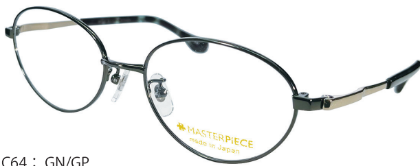
C64 : GN/GP グリーン / GP