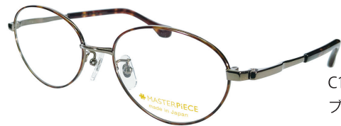
C11 : BR/DM ブラウン / デミ