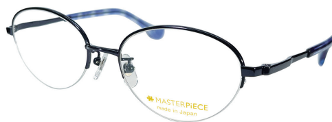
C50 : NV ネイビー