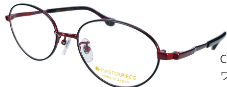
C89 : WN/BK ワイン / ブラック