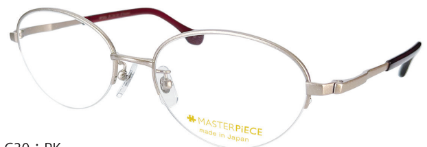
C30 : PK ピンク