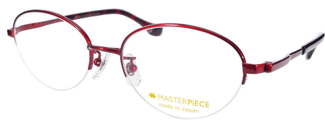
C80 : WN ワイン