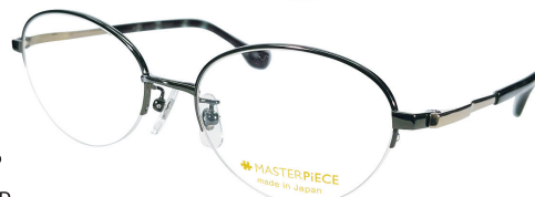
C64 : GN/GP グリーン / GP