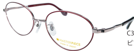
C38 : PK/WN ピンク / ワイン