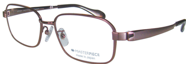
C10 : IPBR IP ブラウン

純日本製による最高の掛け心地への追求と「こだわり」 http://clear-vision.jp/masterpiece