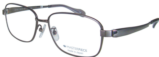
C20 : IPGY IP グレー