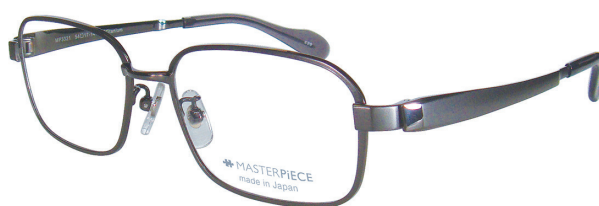
C20 : IPGY IP グレー