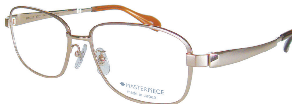
C40 : GP ゴールド