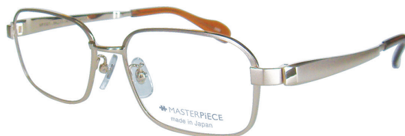
C40 : GP ゴールド