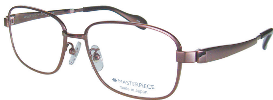
C10 : IPBR IP ブラウン