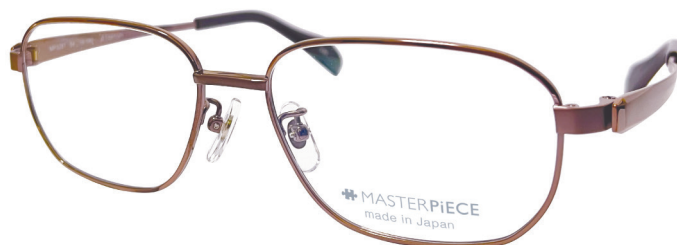
C10 : IPBR IP ブラウン