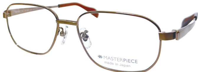
C14 : IPLBR IP ライトブラウン