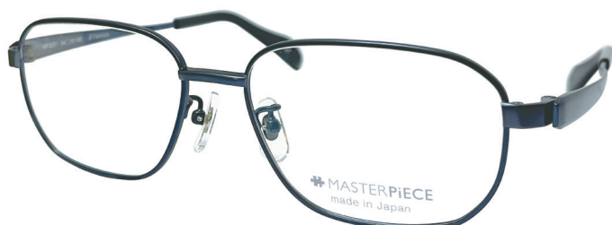
C50 : DBL ミステリアスブルーマット