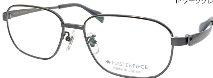
C20 : IPDG IP ダークグレー