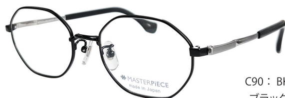
C90 : BK ブラック