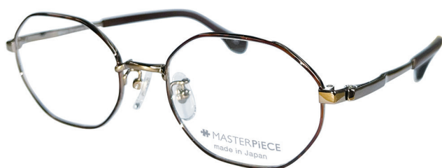
C11 : BR/DM ブラウン/デミ

純日本製による最高の掛け心地への追求と「こだわり」 http://clear-vision.jp/masterpiece