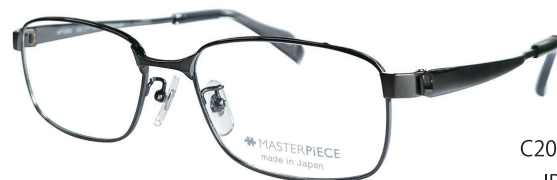
C20 : IPGY IP グレー