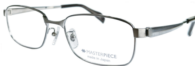
C70 : TITAN チタン無垢