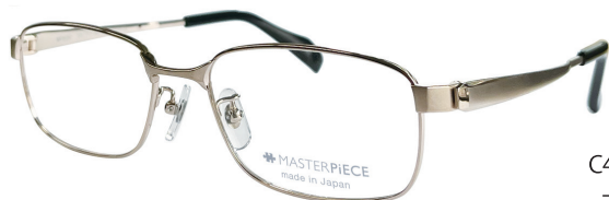
C40 : GP ゴールド