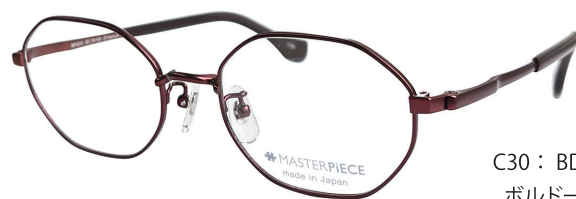
C30 : BD ボルドー