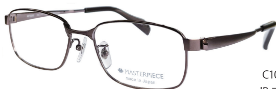
C10 : IPBR IP ブラウン