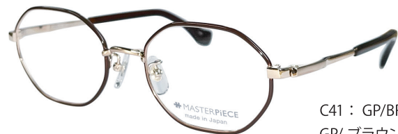
C41 : GP/BR GP/ ブラウン