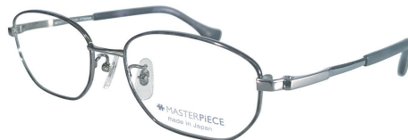
C22 : GY/DM グレー / デミ