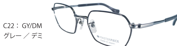
C22 : GY/DM グレー / デミ