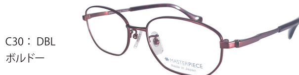
C30 : DBL ボルドー