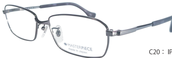
C20 : IPGY IP グレー