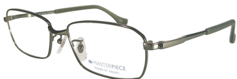
C60 : OV オリーブ