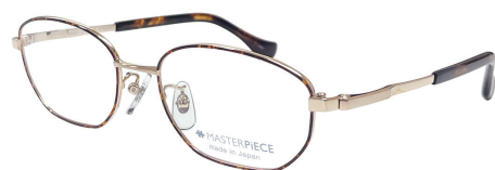
C41 : GP/DM GP / デミ