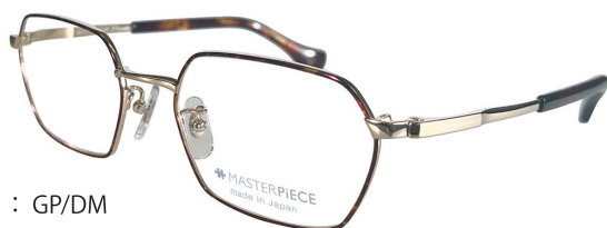
C41 : GP/DM GP / デミ