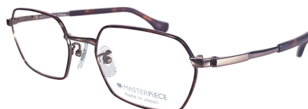
C11 : BR/DM ブラウン / デミ