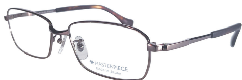
C10 : IPBR IP ブラウン