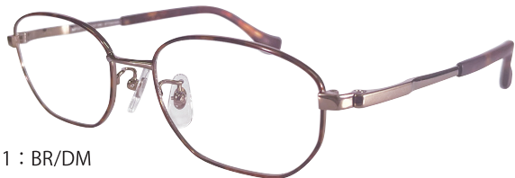
C11 : BR/DM ブラウン / デミ