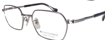
C70 : TITAN チタン無垢