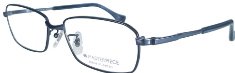
C50 : DBL ダークブルー