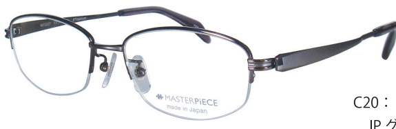
C20 : IPGY IP グレー