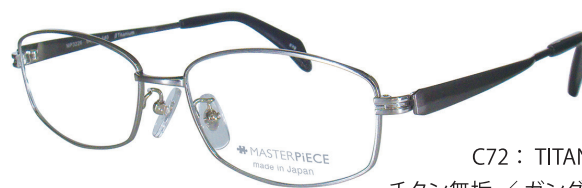
C72 : TITAN/GY チタン無垢 / ガングレー