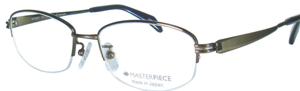
C60 : OV オリーブ