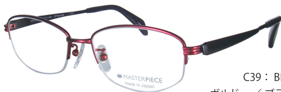
C39 : BD/BK ボルドー / ブラック