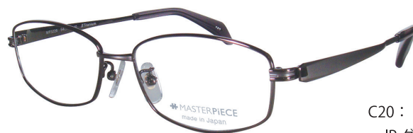
C20 : IPGY IP グレー