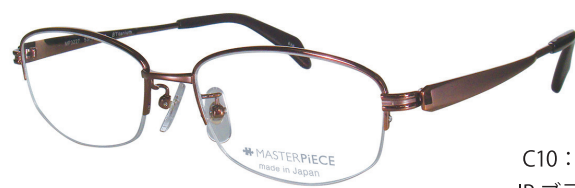
C10 : IPBR IP ブラウン