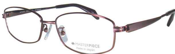
C10 : IPBR IP ブラウン

純日本製による最高の掛け心地への追求と「こだわり」 http://clear-vision.jp/masterpiece