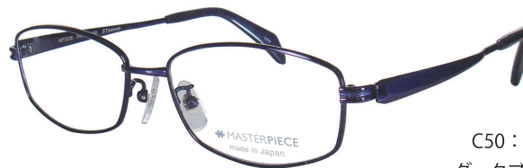
C50 : DBL ダークブルー