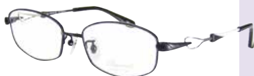
C 97 : ブラック / WP