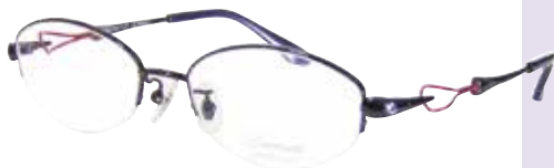
C 58 : ネイビー / ワイン