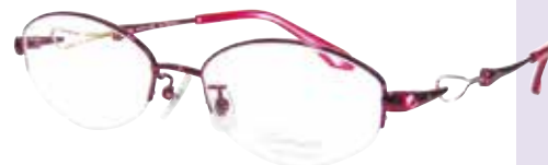
C 84 : ワイン / GP