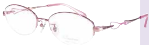
C 33 : ピンク / ピンク

リム : βチタン / ブリッジ : βチタン / ヨロイ : βチタン テンプル : βチタン / テンプルライン線材 : Bio-Ti Lex