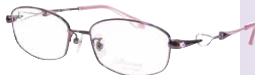
C 57 : パープル / WP

リム : βチタン / ブリッジ : βチタン / ヨロイ : βチタン テンプル : βチタン / テンプルライン線材 : Bio-Ti Lex