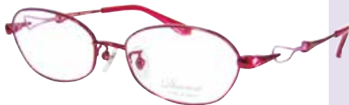
C 83 : ワイン/ピンク