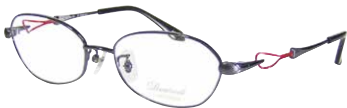
C 23 : グレー/レッド

リム : βチタン / ブリッジ : βチタン / ヨロイ : βチタン テンプル : βチタン / テンプルライン線材 : Bio-Ti Lex