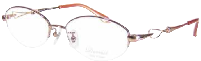
C 14 : ブラウン / GP

リム : βチタン / ブリッジ : βチタン / ヨロイ : βチタン テンプル : βチタン / テンプルライン線材 : Bio-Ti Lex