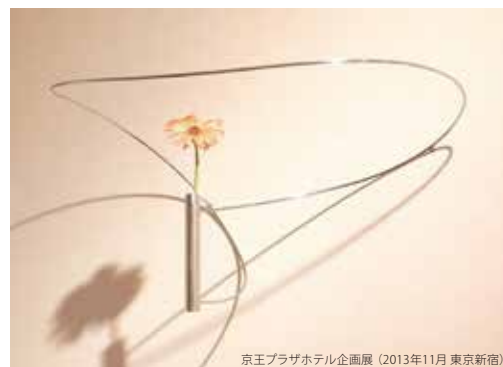
京王プラザホテル企画展 (2013年11月 東京新宿)