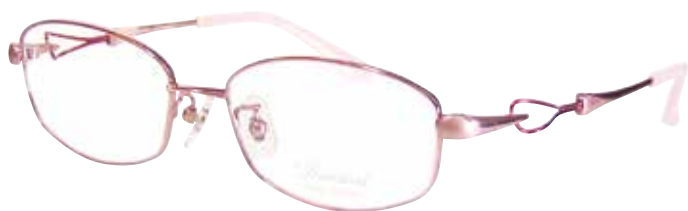
C 38 : ピンク/ワイン

リム : βチタン / ブリッジ : βチタン / ヨロイ : βチタン テンプル : βチタン / テンプルライン線材 : Bio-Ti Lex