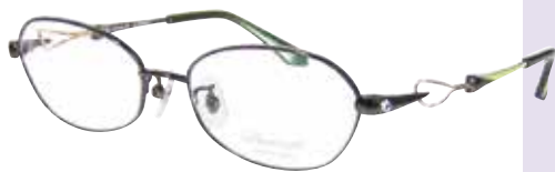
C 64 : グリーン / GP