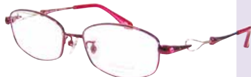
C 84 : ワイン / GP