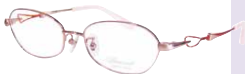
C 34 : ピンク/オレンジ

リム : βチタン / ブリッジ : βチタン / ヨロイ : βチタン テンプル : βチタン / テンプルライン線材 : Bio-Ti Lex